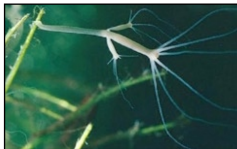
Ovenstående billede (og forsidebilledet) viser en Hydra species .

Hercules begravede det udødelige hoved under en stor sten, og skar kroppen op for at dykke sine pile i Hydras giftige blod. Hercules brugte senere sine forgiftede pile til at dræbe kentauren Nessus.