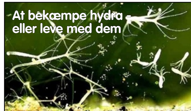
Billedet viser et akvarium med hydra. Bemærk de små hvide prikker.

De små hvide prikker er hydra kolonier og de skal nok udvikle sig, hvis omstændighederne er gunstige for deres udvikling og formering.