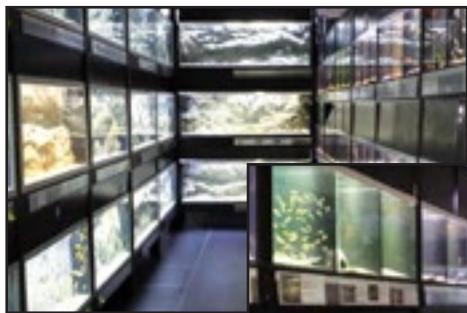
En del af Akvariebutikkens interiør.

En rigtig flot butik med mange store akvarier og god plads omkring dem.