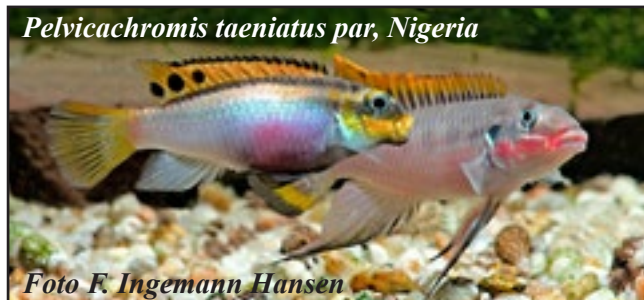
Pelvicachromis taeniatus par, Nigeria